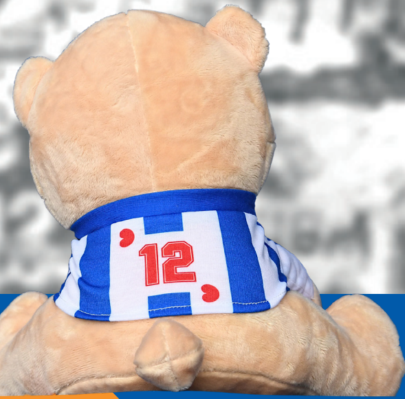
Als een maat achter sc Heerenveen beer

— sc Heerenveen (@scHeerenveen) October 24, 2020